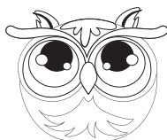
10. Buik met pluimen