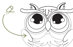
11. Vleugels + lijn buik (onder vleugels) uitgommen